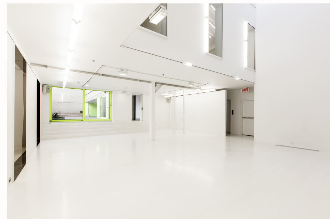
Grande salle de la galerie