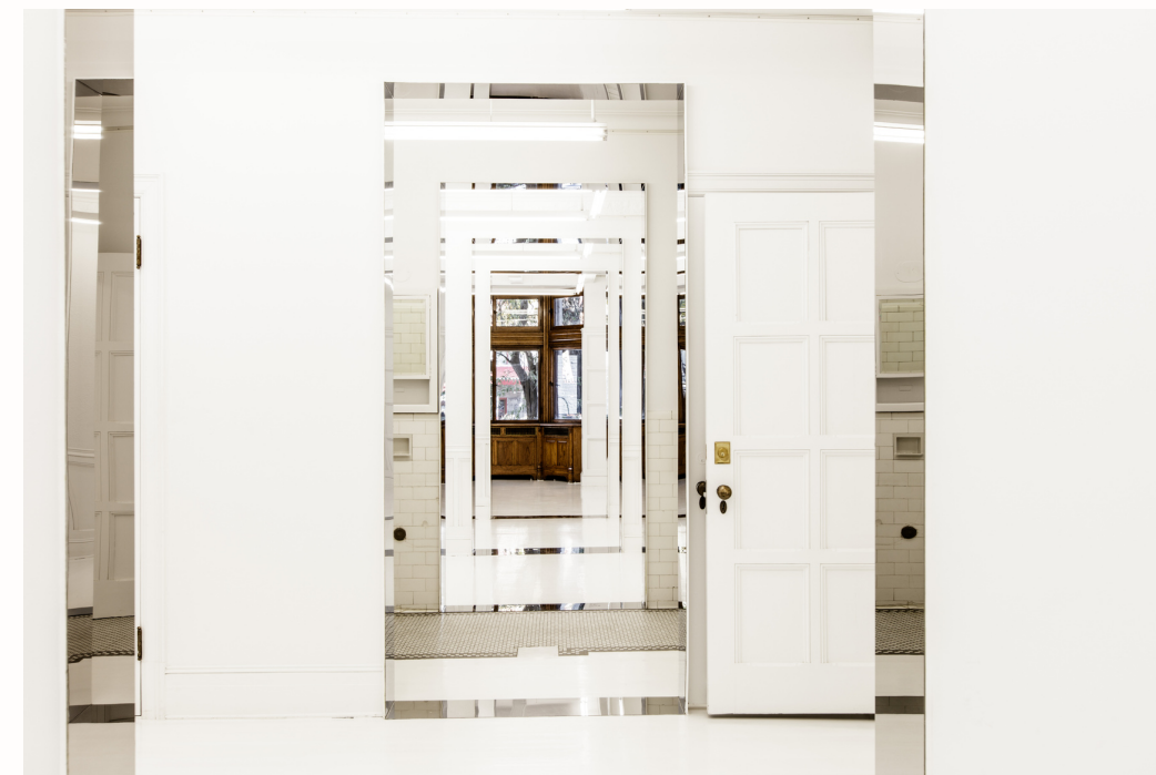
Corridor liant les petites salles