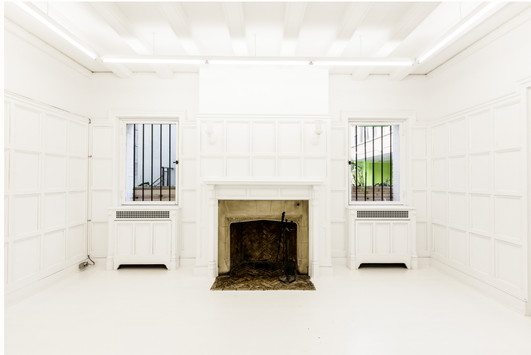
Espaces 104 et 106