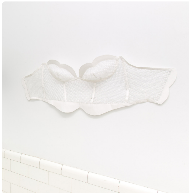
→ ALICE DUFOUR Bustier oxymore III, 2021, den- telle de lin tricotée, papier de coton fait-main 28" x 15"