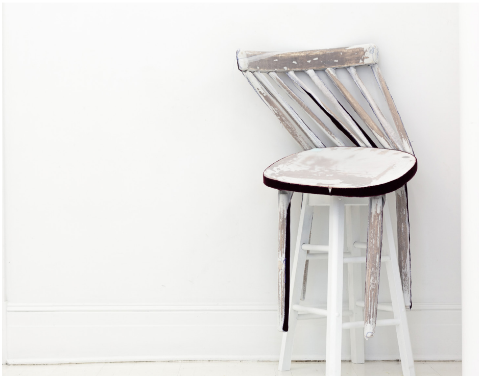
↑ ELISABETH PERRAULT Witness chair #2, 2021, tissu et bois dimensions variables