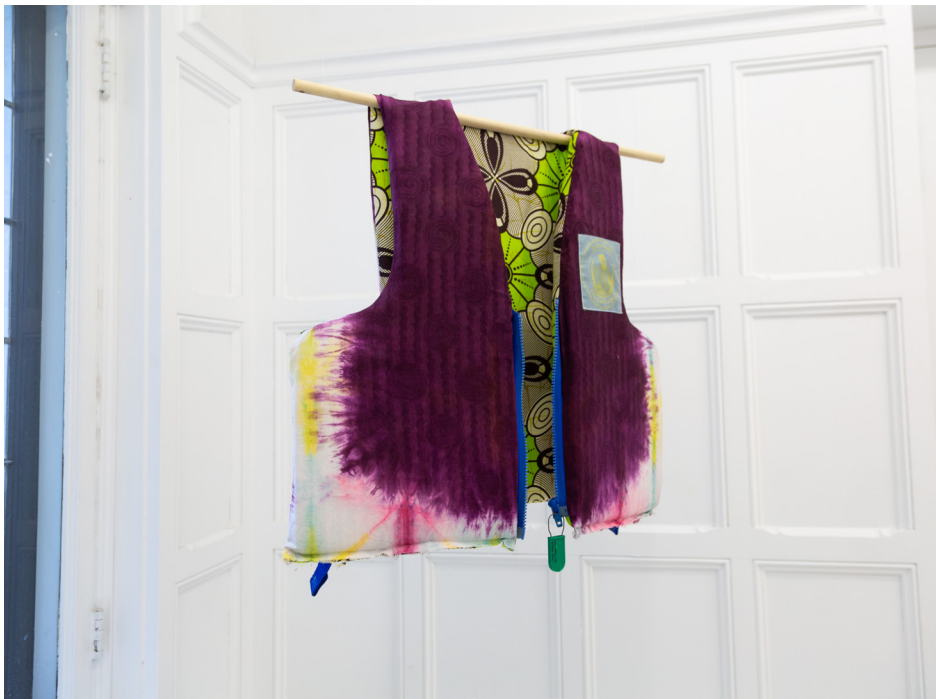
↑ COLAS EKO Veste de Sauvetage, 2019, pagne wax, bazin, foam 15"x24"