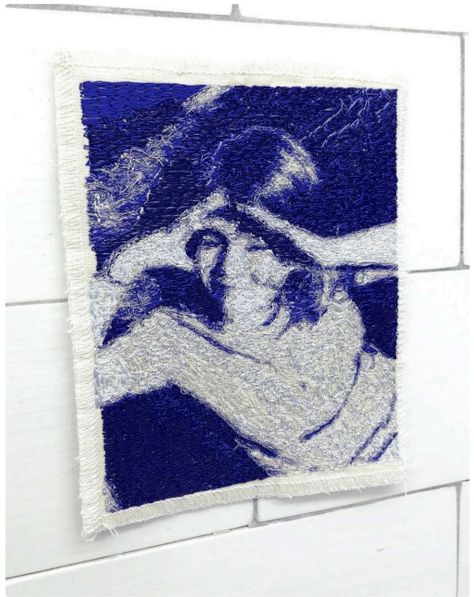
↑ HÉLÈNE PECQUEUR Portrait, 2020, broderie technique Sfumato sur toile de coton 4" x 5"